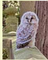
堀兼神社で赤ちゃんフクロ ウが子ども達の成長を祈念 して鎮座していました。 フクロウ赤ちゃん(所沢市)