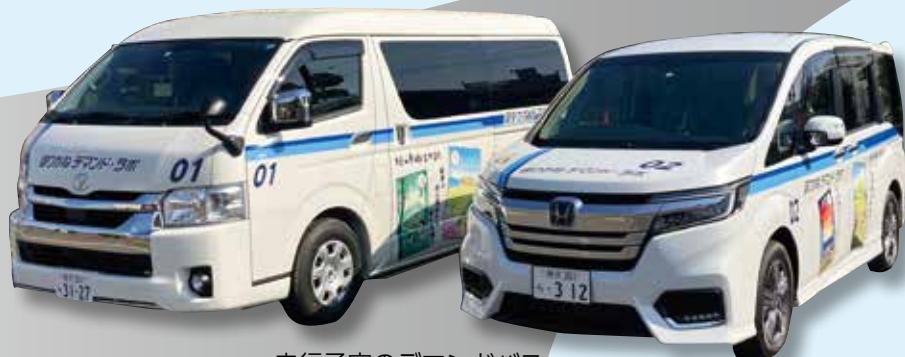
走行予定のデマンドバス

利用や収支の実績、利用者の評価などに基づき検証を行います。それにより地域で運行内容を見直し、利用しやすい形に変更していきます。