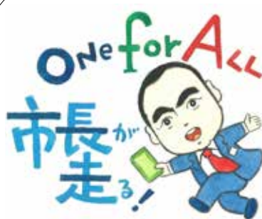
題字・絵 池原 昭治氏