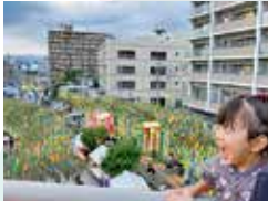
初めての七夕まつり♪ 上からの景色が圧巻 で、思わずシャウト! ササミ(新狭山)