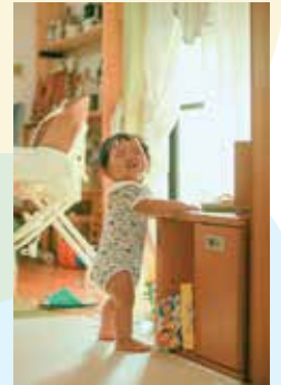
何でもない日の朝。フォトグ ラファーの息子として洗練 されたこの特大スマイル! @and_midori(柏原)