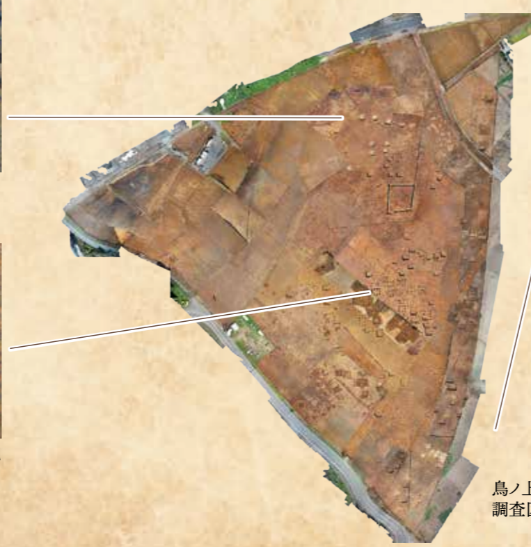
鳥ノ上遺跡第3次調査調査区の空撮写真(合成)