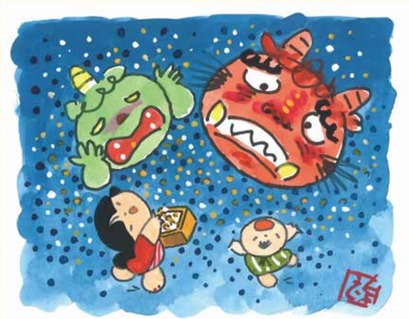
題字・絵・文／池原昭治氏