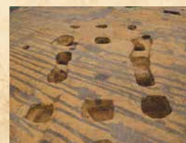
掘立柱建物跡(8世紀後半～9世紀初頭)

地面に穴を掘り、柱を穴に埋めて建てられた建物。鳥ノ上遺跡では居住用ではなく、倉庫のような物資を集積するために使われていたと考えられている。