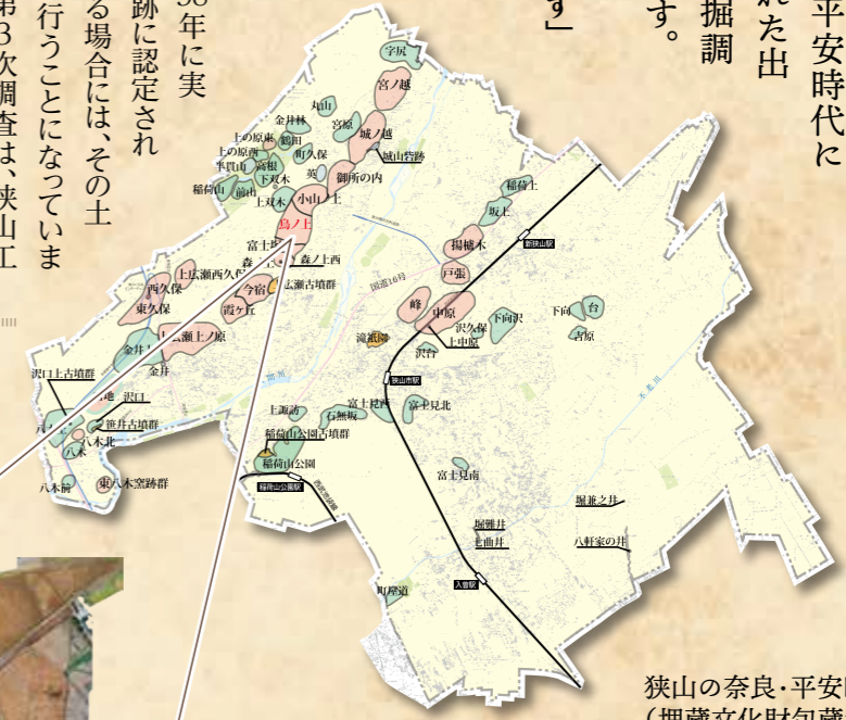
狭山の奈良・平安時代の主な遺跡(埋蔵文化財包蔵地図)

約8万㎡に及ぶ発掘調査の結果、住居跡177軒、掘立柱建物跡93棟、溝跡13条、多数の土壙などが発見されました。住居跡には当時使用された土器が残っていて、この土器の年代から建物のおおよその年代が特定されました。