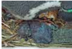
孵化したばかりの頃

2019年に新設したペンギンビーチにやってきた6羽のペンギンたちが順調に成熟し、繁殖可能な年齢となりました。そして、昨年9月に待望のひなが1羽孵化。ウェブ投票が行われ、1月15日に名前が「海来」に決定しました。名前の由来は、お父さんの「らい」とお母さんの「春海」から取ったものです。