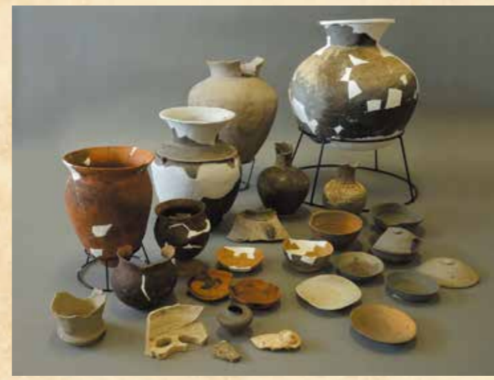
鳥ノ上遺跡から出土した土器

*1 窯を使って1,000度以上の高い温度で焼かれた土器。青灰色で硬質 *2 野焼きで焼かれた土器。茶褐色でやや軟質