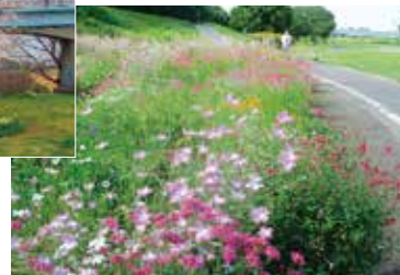
会が管理する花壇