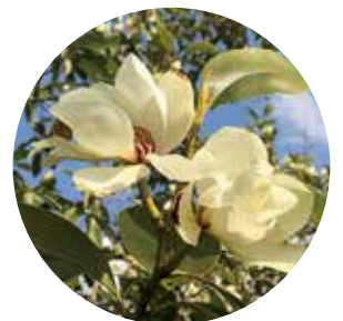
ミヤマガンショウ