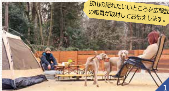
狭山の隠れたいところを広報課の職員が取材してお伝えします。