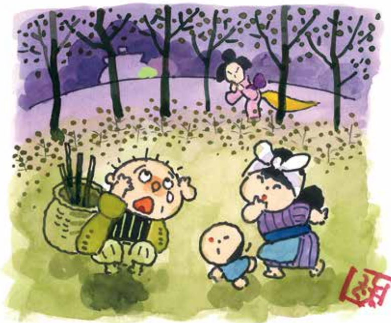
題字・絵・文／池原昭治氏