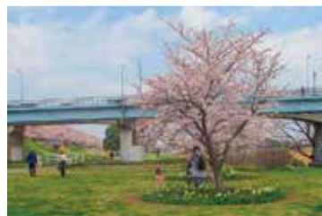
新富士見橋上流側の桜

また、4月中旬になると芝生一带にカントウタンポポが群生します。この花が作り出す黄色の絨毯 じゅうたん を見るのが、今から楽しみです。ここではその後もシロツメクサ、アカツメクサ、ネジバナなどの自生の花が咲いてきます。近くでは「みんなの花壇」にもたくさんのお花が咲いていますよ。ぜひ足を運んでみてください。