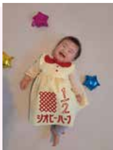
しおぴー 1/2BIRTHDAY しおぴー(柏原)