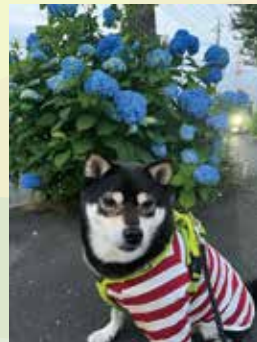
お散歩道にキレイなアジサイ がいっぱい咲いてます♪ みんちゃん(中央)