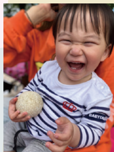
智光山公園でピクニック! とっぴー(祇園)