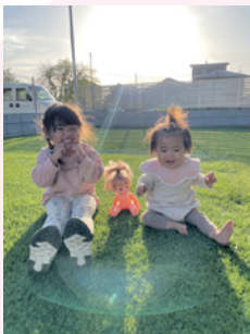
新築のお庭で3姉妹♪ 狭山HOMIES(上奥富)