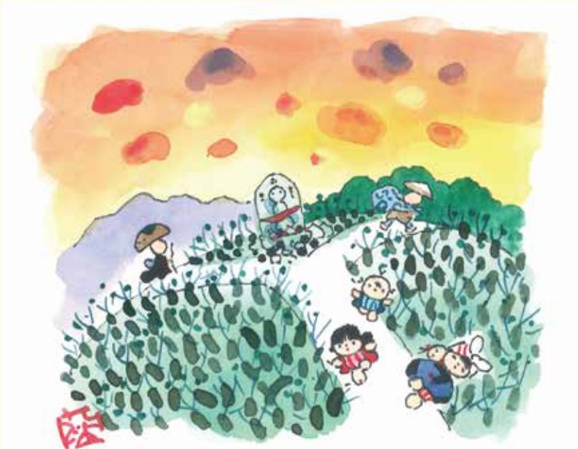
題字・絵・文／池原昭治氏