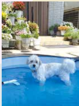
水浴びしてクールダウン♪ ラピト(新狭山)