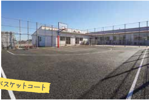
バスケットコート