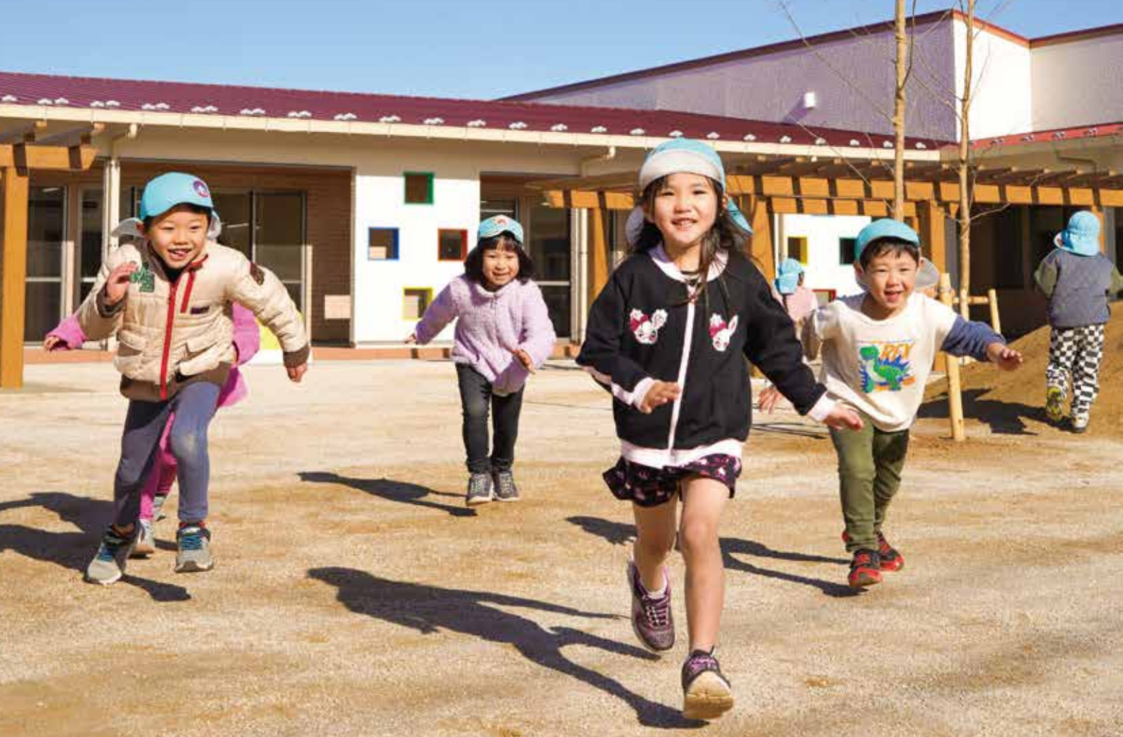
撮影場所：狭山市いりそ次世代支援センター「I palette」