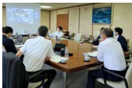
予約本部会議で各地区の状況を確認

さて、この取り組みのMVPは、と問われれば、間違いなく地域の皆さんだと答えます。行政だけでは非常に困難でした。自治会長をはじめ、自治会役員や民生委員の皆さんは、わが事として、協働の精神で力を貸してくださいました。予約で会場を訪れた高齢者、ご協力いただいた地域の皆さん、そして市の職員がお互いに「ありがとう」と伝え合う光景は感動的でした。