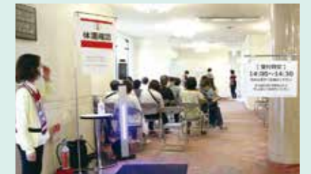
集団接種会場のようす