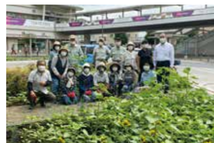
西口ロータリーで市民グループの方々と

7月23日に開幕予定のオリンピックは、私たちが当初、想像したものとはかなり異なる状況下での開催となります。コロナ禍でも選手たちはこの大会を目指して全てを懸けてきたはず。大きな歓声を上げるわけにはいきませんが、狭山ゆかりのアスリートをはじめ、世界中のトップアスリートの活躍を静かに、そして熱く応援したいと思います。