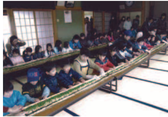
大人と協力して10mのり巻きづくり

私たちの自治会は、今でも田園風景を残す奥富地区にあり、狭山市の1番北、川越市に隣接する場所に位置しています。約310世帯で構成され、さまざまな活動をしていきますが、中でも老若男女が集まる、ふれあい大芦桜まつりは、各種団体の協力を得て、地域の皆さんが食べて飲んで、気軽に交流できる場になっています。最近の傾向は、子ども達の参加が多く、大人と子どもが一緒にのり巻きのり巻きづくりやソーマン流し、ビンゴゲームなどを楽しみ、集会所は笑顔でいっぱいになります。これからも地域の「顔見知り」という財産を大事にしていきます。