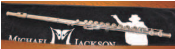
私のパートナーのような存在です