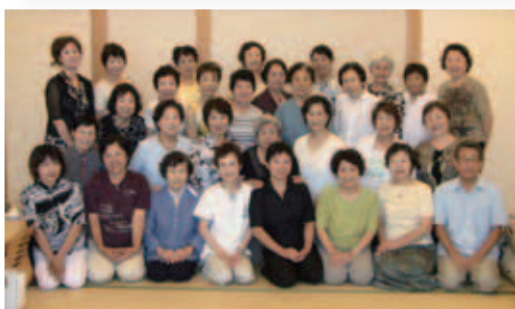
総会後には懇親会を開催。全員で記念撮影