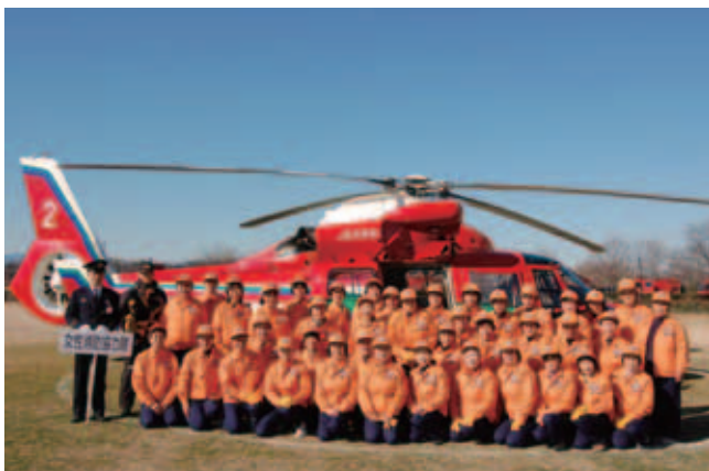
平成23年狭山市消防出初式に参加