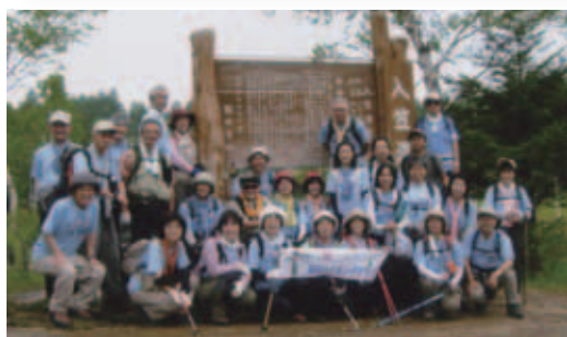
山登りは、健康増進と長生きの栄養素です

2月19・20日(土・日)に智光山公園で野鳥観察会が行われ、参加した8名の皆さんは、カワセミなどの野鳥が自然の中で息づくようすを観察しながら、智光山の自然を満喫しました。