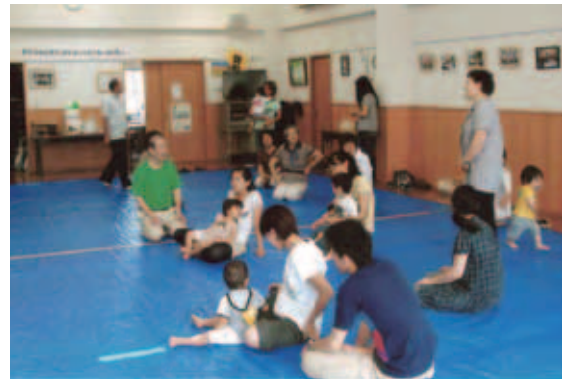
子育てのちょっとしたお手伝いができればと思っています

水押自治会は、昭和30年代から住宅地として開発された北入曽の一角にあります。現在は1千320世帯まで増加して、入曽地区では最も世帯数の多い自治会になりました。平成12年ごろから、狭山市乳幼児情報センター主催のワイワイ広場の開催場所として、毎月1回集会所を提供してきました。その後市から事業を自治会で運営してもらえないかと提案があり、20年度からは自治会主催の子育て支援広場として現在に至っています。民生児童委員やボランティアの皆さんの協力をいただきながら、地域をあげて元気に子育て支援に取り組んでいます。