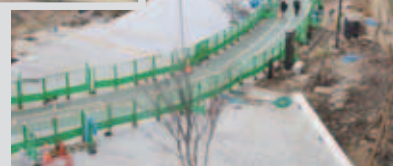
駅前広場から見た 工事の進む市民広場

狭山市駅西口再開発事業で整備している市民広場が完成し、3月15日 から全面通行可能となる予定です。