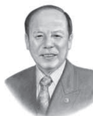
狭山市長 仲川幸成 似顔絵・花倉正喜氏