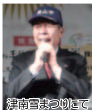
津南雪まつりにて

2/1...全国基地協議会・防衛施設周辺整備全国協議会合同役員会 2/2...埼玉西部広域事務組合議会全員協議会・定例会 2/6...埼玉県消防広域化第4ブロック構成市市長会議 2/9...埼玉市長会西部ブロック市市長会議 2/13...廃棄物減量等推進審議会 2/14...振興計画審議会 2/16...定例庁議、救援対策本部会議、社会福祉審議会 2/20...定例記者会見 2/23...市議会第1回定例会 2/25...津南雪まつり 2/27...環境審議会