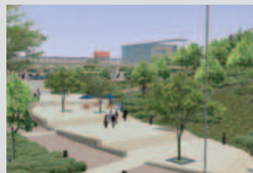
図書館側から見た市民広場の完成予想図