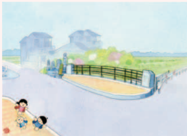
題字・童絵/池原昭治氏