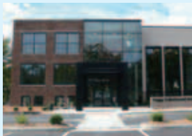
文化都市を象徴する建築物

2012年秋には、狭山市との美術交流展も開催され、アメリカにおける市民協働のモデルとしても注目すべき施設となっています。