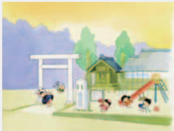
題字・童絵／池原昭治氏