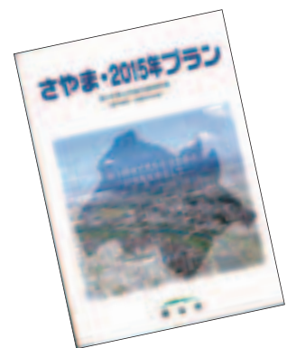
【現在の総合振興計画】