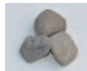
いつかこの石のあった地を妻と旅したいです

この石は、ふだん棚に飾ってあり、ふとした時に見ると旅先での気持ちを思い出させてくれます。そして、自分の親や妻の親、家族を大切に