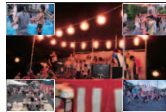
年齢の垣根を越え、自治会員一体となって楽しみ、交流を深めました

私たちが住むつつじ苑は、昭和47年に分譲開発され、自治会も今年で発足35周年を迎えました。少子高齢化により、自治会のイベントは縮小傾向にありますが、当自治会では発足当時の活気あふれる時代を掘り起こそうと、35周年を記念して初めて2日間にわたる夏祭りを開催しました。初日はニジマスのつかみ取りなど、子ども達の歓喜の声にあふれ、翌日は苑内に響き渡る子ども神輿の掛け声を皮切りに、大舞台のフラダンス、よさこい踊り、太鼓、カラオケ大会、そして数多くの模擬店で大盛況となりました。故郷のよさ、絆の大切さを見つめ直すことができた2日間、たつたと実感しています。