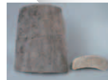
今回紹介したものはホームページでも詳しく解説しています。ぜひご覧ください。

狭山市の一般的な住居跡から、稀に奈良・平安時代の瓦が出土します。瓦の広い面は格子状や縄目状の文様で、ザラザラしています。一方狭い面は、丁寧に面取りされており、精緻な焼き物の手触りがします。当時瓦は、寺院や政庁の屋根を葺くためのもので、一般的な住居の屋根材に瓦は使用されていませんでした。出土した瓦は、規格外品や余剰品の再利用として、竈の補強材や砥石として使用されていたようです。