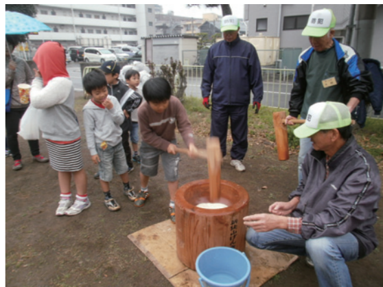
ペタコン！ペタコン！といい音が響きます

新狭山三丁目自治会は、新狭山駅の南側に位置し、本田技研工業株式会社埼玉製作所に隣接しています。商店やマンション、戸建て住宅などがあり、会員は約500世帯です。私たちの自治会では、会員同士の交流を大切にしています。11月9日(日)に開催した「もちつき大会」では、子ども達が、大人と息を合わせて餅をついたほか、射的やスリッパ飛ばしなどのアトラクションでも、世代を超えて交流を楽しむことができました。地域のみんなで企画したイベントに、大勢の方が参加し交流する中で作られていく「つながり」が、私たちの自治会の宝です。