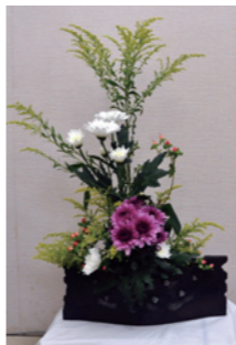
季節の花を自作の花器で

花が紡いでくれた人との出会いが私の宝物。これからは新しい出会いを大切にしながら、私の心の中に一つひとつ重ねていきたいと思っています。