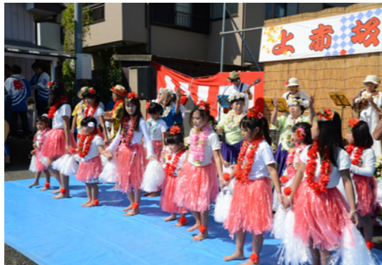
子ども達のフラダンス。観客の皆さんから大きな拍手が沸き起こりました

私たちの自治会は、古くは上赤坂村といわれた集落にあります。会員数は128世帯で、そのうちの約四割は新しく転居してきた方々ですが、ほぼ100%の加入率を誇っています。私たちの地区には、伝統芸能の獅子舞があります。戦後中断していたものを、平成元年に有志の尽力で復活させました。今では、毎年10月の秋祭りや奉納され、カラオケ大会やフラダンス、模擬店の出店などとともに、自治会主催の上赤坂祭りとして、小さな子どもから寿会の方まで楽しんでいきます。この祭りは、地域の絆やコミュニケーションを一段と深めてくれています。