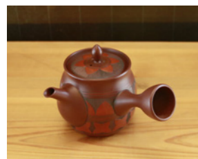
片手に収まる小ぶりな朱泥急須

今思い返すと、急須を挟んで父と向かい合ったあの時間こそが、かけがえのない父と子のつながりを感じることができた時間です。