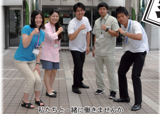
私たちと一緒に働きませんか

狭山市では、やる気のある人材を求めています。一緒に市民のため、市のために情熱を注ぎませんか。「我れこそは」と思う方、ぜひご応募ください。平成28年度採用職員の募集は7月30日(木)～8月1日(土)です。