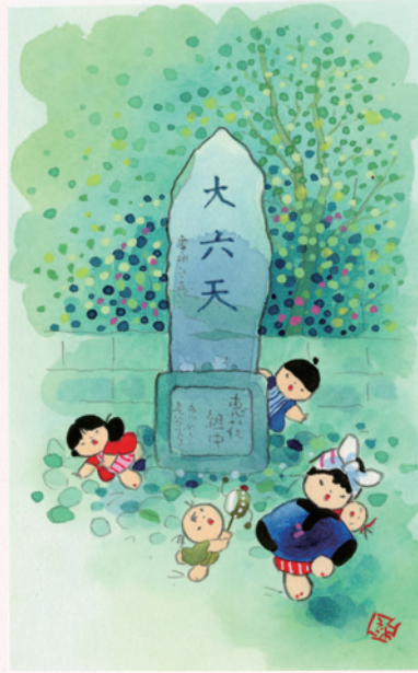
題字・童絵 / 池原昭治氏