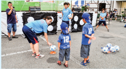
写真は昨年のような

また、ASエルフェン埼玉のオフィシャルグッズも販売します。ぜひ、足をお運びください。