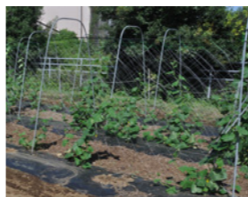
地域の方とのイベントも行います

自然と向き合い、共に生きていく今の生活は、私だけでなく子どもたちにとっても、とてもやさしく感じられます。おかげで家族のみんなが、ストレスを感じることはない生活を送ることができています。いつでも畑仕事ができる今の生活を大切に、いつまでもこの狭山市で、生き生きとした毎日を過ごしていきたいと思っています。