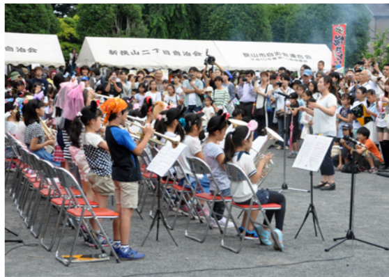
新狭山小学校音楽クラブの演奏は、あじさい祭りを大いに盛り上げました

新狭山二丁目自治会は、新狭山駅北口から国道16号までの間に位置し、会員数は1千300世帯を超えます。当自治会では年間をおして多くのイベントを開催しています。特に、6月に中原公園(通称あじさい公園)で開催する「あじさい祭り並びに国際交流の集い」は、大勢の人で賑わいます。ほかに、納涼盆踊りや子どもみこし巡行を行う夏祭り、秋の体育祭、3月の六年生を送る会などのイベントを開催するほか、夜間防犯パトロールなども行っています。行事などをおして培ってきた地域のつながりが財産。この宝を活かして、安全・安心のまちづくりに努めています。