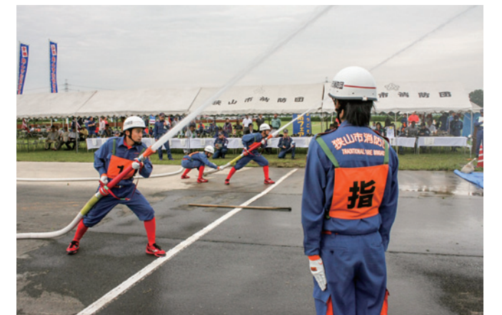
火点に向かってまっすぐ放水するには高い技術が必要

各分団の部・班から選抜された精鋭で組んだ18隊が参加。簡易水槽から給水し、火災現場を想定した火点(的)を倒すまでの速さと正確さを競いました。迅速で確実な操法を披露した選手は地域を守るプライドと使命感に満ちていました。