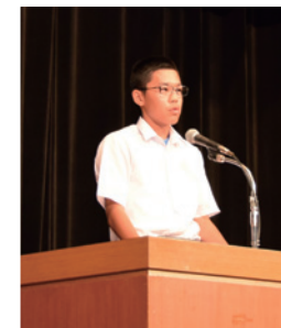
「広島市原爆死没者慰霊式並びに平和祈念式」の感想を述べる中学生