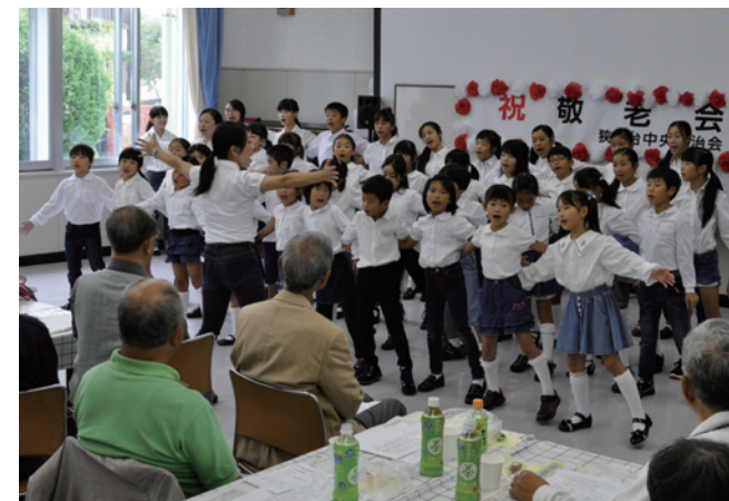
僕らの夢を 大きくのせて～♪

来年創立35周年を迎える狭山台児童館。これを記念して合唱曲「夢を大きくのせて」を作成しました。この日行われた地区の敬老会で、児童館の合唱団が、透きとおった歌声と、夢や希望に満ちた歌詞をプレゼントしました。