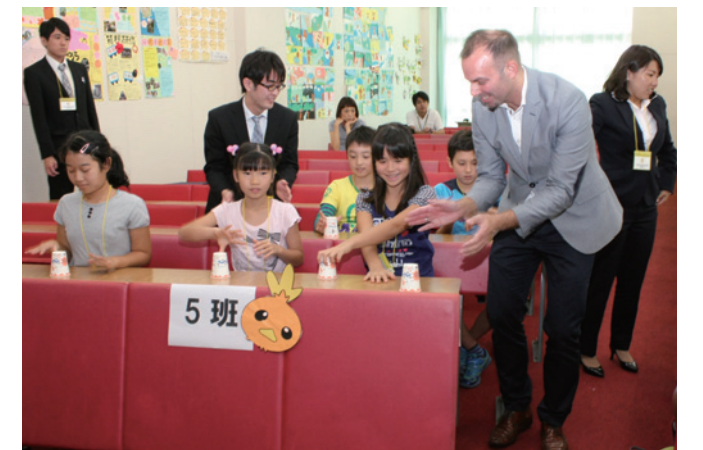
音楽に合わせて紙コップで出る音でリズムを取る

小学校とは一味違う知識が学べる「子ども大学さやま」が開校しました。初回の講義は「音楽をもっと楽しもう!」。楽器の演奏ばかりが音楽ではないと、生活の中で使用するさまざまな物が出す音を材料に、音の不思議な世界を学びました。