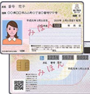
▲個人番号カード(おもて・裏)

お手元に届いた「通知カード」とは別に「個人番号カード」(マイナンバーカード)は本人の申請で交付します。