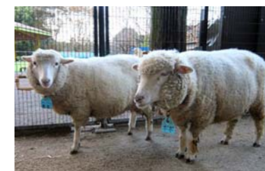
【子ども動物園】 柏原864-1 ☎2953-9779 月曜休園(祝日の場合は翌日) 【ヒツジデータ】 偶蹄目ウシ科 体長約100~150cm 体重約50~100kg

Zoom UP どうぶつ園 ⑨ ヒツジ(コリデール) 一年間頑張ってきた今年の干支「未」。家畜の中で最も多くの品種を誇ります。中でもコリデール種は、ニュージーランドが原産で、強い身体と気候風土への適応力が高いことから飼いやすく、日本でも一番多く飼育されてきました。 当園では、コリデール種のヒツジを1頭飼育しています。名前は「ポポ」。性格は温厚で、雑種の「スー」との間に生まれた娘の「モモ」の子育てに奮闘中。甘えっ子の娘に寄り添う微笑ましい姿をぜひご覧ください。