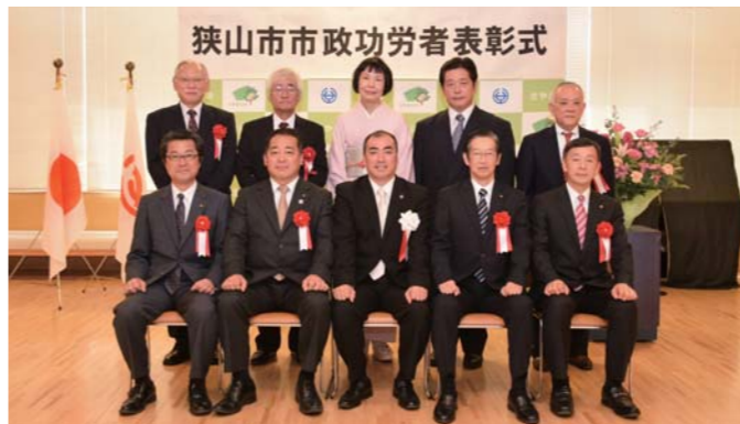
▲一般功労の受賞者