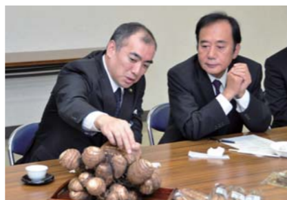
これが狭山自慢の里芋です