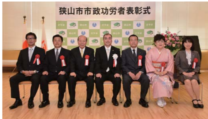
▲特別功労の受賞者