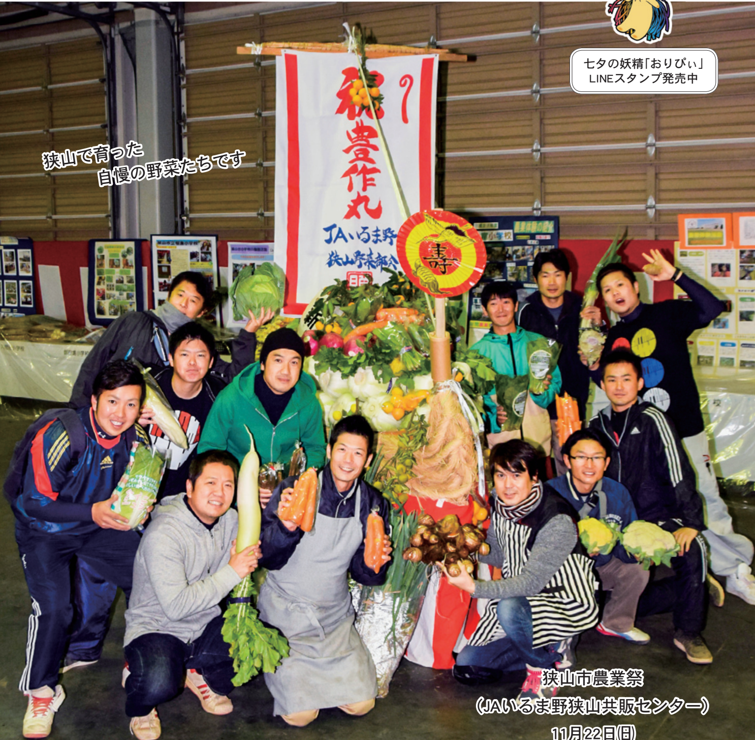
狭山市農業祭 (JAいるま野狭山共販センター)