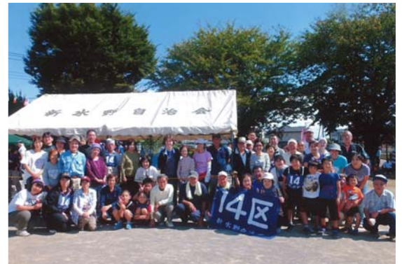
今年の入曽地区体育祭、一致団結して頑張りました

所沢市と人間市の境に位置する私たちの新水野自治会は、今年で結成47年めになります。現在の加入世帯は、158と少なめですが、ご近所同士で声を掛け合うなど、和気あいあいと活動しています。 今年に入曽地区体育祭も4年ぶりに開催され、子どもから大人までスポーツの秋の一日を楽しむことができました。順位も少し上がって、17位になりました。 また、憩いの場である新水野公園は、夏祭りの会場でもあり、みんなで清掃活動を行っています。少ない世帯だから、どんなこともみんなで協力して、顔の見える関係を大切にしています。