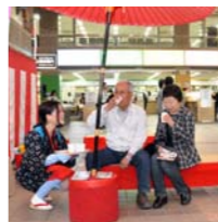
茶娘衣装や茶は飲んで、イベントでの湯茶接待の方を募集します。活動日数は平成28年度内の10日程度(日曜・祝日を含む)です。

交通事故のない地域を目指して活動しているボランティアです。 活動内容交通安全街頭活動や交通安全イベントへの参加など 申込み交通防犯課へ内線3692