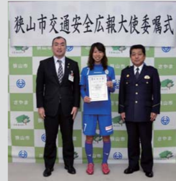
狭山市交通安全広報大使委嘱式