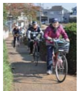
狭山市の良いところ「お宝探し」と、環境にやさしい自転車活用促進を目的に、「サイクリングフェスタ」を4回開催。作成したサイクリングのガイドマップを持って、自転車で市内を走り、狭山市の魅力を見ました。

市民提案型協働事業を3年間実施し、現在も事業を継続している会の声です。 24・26年度市民提案型協働事業「さやまサイクルタウン構想」 狭山まちづくりリストの会 市民提案型協働事業として3年間、狭山市の良いところ「お宝探し」と、環境にやさしい自転車活用促進を目的に、「サイクリングフェスタ」を4回開催。作成したサイクリングのガイドマップを持って、自転車で市内を走り、狭山市の魅力を見ました。