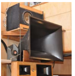
ステージの奥行きさえも感じられます

レコードの音が出た瞬間から、自宅はライブハウスに早変わり。目の前で生演奏を聞いているような感覚は、極上です。今では月に一度レコード鑑賞会を開いては、地域の方と一緒に迫力ある音を楽しんでいます。