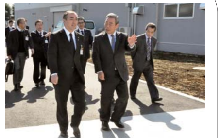
活力の源である企業の誘致も継続します(新規立地企業への訪問)

一方、景気低迷の影響も大きな理由であると思いますが、過去20年間にわたって、転入者数より転出者数が多い「社会減」の状態が続いていました。しかし、平成18年以降、状況が改善されはじめ、ついに去年は転出入の差がちょうどゼロになりました。人口の増減に一喜一憂はできませんが、総合計画の事業を着実に進め、若い世代の人口流入が進む、活力にあふれたまちづくりを進めてまいります。