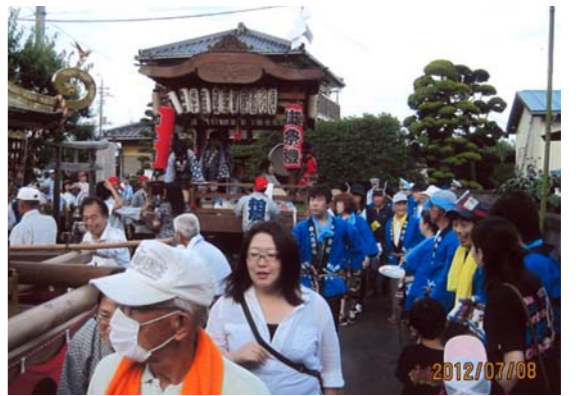
軽快な囃子の音色が、祭りを盛り上げます

東を入間川西岸、西を智光山公園の森に挟まれた自然豊かなふるさとです。狭い地域ですが、神社が二つ、お寺が三つあります。毎年7月初旬に行われる夏祭り「天王様」は、京都八坂神社の祇園祭を祖とする長い伝統に支えられた地域の祭りです。今では古老となられた方々の、「若いころに酒を喰らって神輿で練り歩き、用水路に落ちて大騒ぎになった」などの武勇伝には事欠きません。神社の氏子を中心に、子ども会や自治会のみんなが力を合わせて、盛り上げていくことが、私たち地域の願いです。