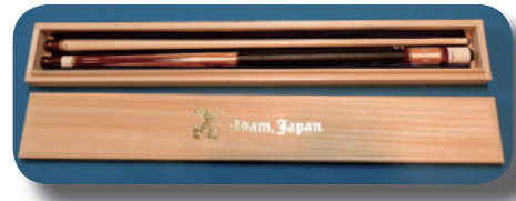
ビリヤードキューセット

この機会に市外にお住まいのご家族やご親戚、お知り合いの方々に、ふるさと「狭山市」へご支援くださるよう、この制度をご紹介します。