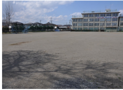
学習活動や交流拠点として期待(入間公民館建設予定地・旧入間中学校)

生涯学習や社会教育の推進／地域課題などを踏まえ、学習成果を住民づくりに進めます。 公民館／快適な生涯学習環境を提供するため、狭山台公民館の空調改修工事を実施します。また新狭山公民館は、29年6月の完成に向けて新築工事に着手します。入間公民館の更新は、入間中学校跡地を活用することとし、地元検討委