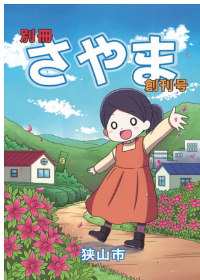
《平成28年4月号の表紙》 狭山市をPRする漫画が完成しました

この漫画は、市の魅力や暮らしやすさを20代後半から30代後半の若者にPRするため作成したもので、「別冊さやま」創刊号として3月に発表しました。