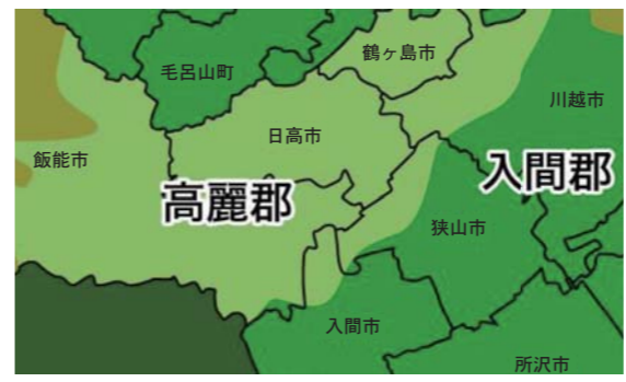
高麗郡に、狭山市柏原地区・水富地区が含まれていた

紀元前37年ころから668年まで、中国東北部から朝鮮半島北部にかけて高句麗という国が栄えていました。「続日本紀」によれば、716年、関東各地に住んでいた高麗人(高句麗から日本に渡つて来た人)1千799名が、当時の武蔵国に集められ「高麗郡」ができました。