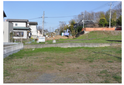
29年度の完成を目指し、道路工事を実施(都市計画道路狭山市駅上諏訪線)

新たな企業・事業者の育成／一般社団法人首都圏産業活性化協会や金融機関と連携し、「ものづくり」の魅力の情報発信に取り組みなど、新たな「創業」などのための総合的な支援を行います。 工業の活性化／「企業立地奨励金制度」の一部改正により、新規企業立地や既存事業所の設備投資を促進するとともに、正規従業員や女性の雇用も促進してまいります。また、事業所の緑化などの負担の軽減も引き続き図ります。 地域商業の活性化／商店街の共同施設の維持管理や地域消費が喚起されるイベントなどの活動を支援します。