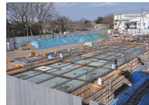
安全で快適に暮らせる良質な環境を提供(鶴ノ木団地B棟)

学校給食の充実／堀兼学校給食センターで、二学期から食物アレルギー対応食を配食します。また牛乳パックのリサイクルに取り組みます。人権尊重意識の高揚／人権問題講演会や啓発活動を充実させるとともに、人権教育に積極的に取り組みます。平和意識の高揚／平和に関する教育や啓発活動を推進します。文化の振興／市民の自主的な文化活動を促進するとともに、文化財の適切な保護や民俗芸能の保存と継承に取り組みます。