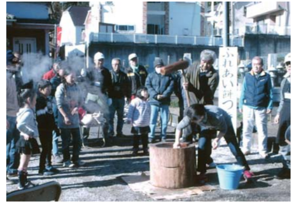
1月24日(日) 自治会館前広場で開催した餅つき大会

私たちの自治会は、水富第5区自治会から分離して、昭和52年4月に設立しました。年々世帯数も増加し、現在は500を超えます。