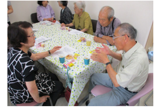
民生委員・児童委員による地域福祉活動を支援(コミュニティサロン活動)

ータルサポート体制」の構築を推進します。さらに、地域福祉の中核を担う民生委員、児童委員の活動も支援します。 子育て支援の充実／母子の健康管理と育児不安を軽減するため、妊産婦・新生児訪問件数を増やします。また、妊娠期の支援を充実させることにより、産後の継続支援につなげます。 仕事と子育ての両立支援／「狭山市子ども・子育て支援事業計画」に基づき、待機児童の解消に向けた取り組みとして、既存私立幼稚園の児童保育室／保育時間を延長するとともに、新たに、入間川東小第一・第二児童保育室、入間野小第一・第二児童保育室、御狩場小学児童保育室、新狭山小第一・第二児童保育室に、指定管理者制度を導入し、運営のさらなる充実を図ります。また、入間川小学童保育室を拡張し、保育環境を改善します。 要保護児童対策／児童相談所や警察など関係部局との情報交換をさらに緊密にするとともに、連携を強化し、虐待やその兆しをいち早く発見し、迅速に対応します。 健康づくりの推進と保険・医療の充実／「第3次健康日本21狭山市計画・第2次狭山市食育推進計画」を策定し、市民がともに支え合い、