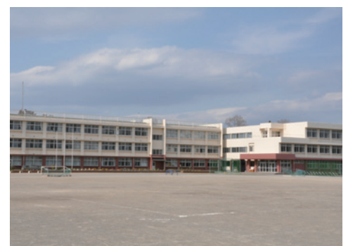
災害発生時に備え、校舎の屋上に太陽光発電設備を設置(狭山台中学校)

市民ニーズに対応できる機能的な組織を確立し、合わせて、適正な定員管理と、総合的な人事管理制度のもと、職員一人ひとりの能力が最大限発揮できる、活力のある組織づくりに努めます。