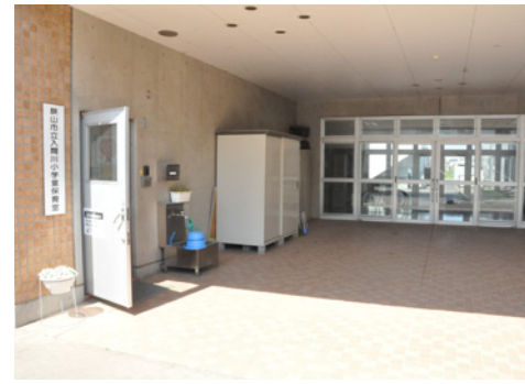
良好な保育環境を維持するために改修を実施(入間川小学童保育室)

「ごみの収集業務／全面委託化を進めるなど、効率化に努めます。」 稲荷山環境センター／施設の長寿命化を図るため、施設の運転管理の徹底と改修を実施するとともに、環境に配慮した機器を設置し、二酸化炭素などの排出削減に努めます。 福祉の総合的な推進／「人が人を支え、みんなにやさしい、元気なまち」の実現に向け、多くの市民が地域の福祉活動に参加しやすい環境を作るとともに、活動団体の設立支援や地域福祉ネットワーク化を支援します。また、複合的な課題を抱える世帯に対応するための「ト