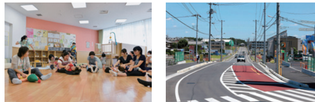
活用方法の一例(児童福祉や都市基盤整備)

●市の魅力が詰まった返礼品を多数ご用意しました 市内外を問わず、1万円以上の寄附をいただいた方に返礼品をお贈りします。