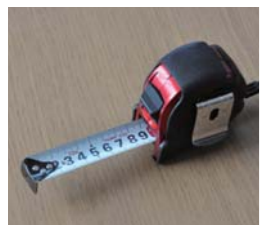
部屋が片付くと、皆さん笑顔になります

この思いを多くの人に伝えるため、整理収納の仕事を始めたときに何十種類もあるものの中から出会ったのが、このコンベックスです。片づけの第一歩はスペースを測ること。幅が広くて数字が大きく見やすいこのコンベックスを、いつも腰にぶらさげ、今では体の一部のような。これからも、フルに活用して皆さんの整理のお手伝いをしたいと思っています。