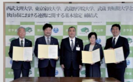
(左から宮本武蔵野短期大学学長、高橋武蔵野学院大学学長、小谷野市長、川合東京家政大学学長、徳田西武文理大学学長)

4月18日(月)、狭山市と西武文理大学、東京家政大学、武蔵野学院大学、武蔵野短期大学の4大学が、それぞれ連携に関する基本協定を締結しました。