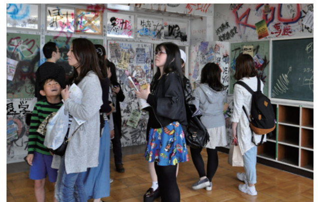
思い出の校舎が映画のワンシーンに

人気マンガを実写化した映画の一部に使用されたセットを2日間限定で公開しました。撮影で使用された教室に入った来場者は、出演者と同じ空気を味わい、興奮気味のような様子。キャラクターの等身大パネルの前では記念撮影の長蛇の列ができました。