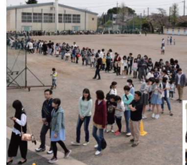
思い出の校舎を一目見ようと卒業生も多数訪れました