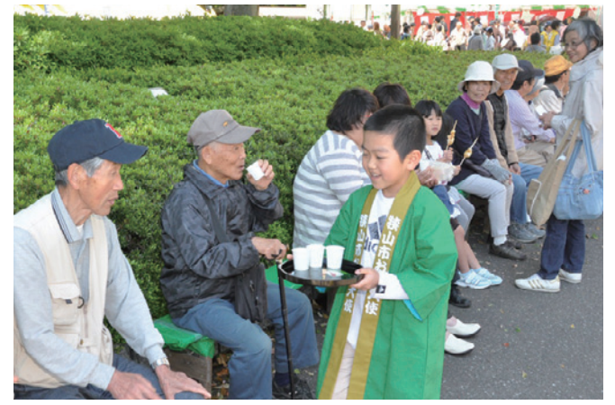
例年以上の新茶の出来に笑顔がはじけます

市内で一番早く新茶を味わえるこのイベント。恒例の茶摘み体験では、参加者が柔らかな新芽の感触を楽しみました。新茶の試飲や手もみ茶の実演なども行われた会場内は、この季節を心待ちにしていたおよそ6,000人の来場者で賑わいました。