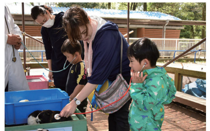
テンジクネズミの心拍数は人間の約4倍です

毎日世話をしているから分かる、サルやカピバラなどの生態を、飼育員がユーモアたっぷりに解説するこのイベント。ほかにも、ミニブタとお散歩したり、30kgの乾草を持ち上げたりするコーナーなど、参加した子ども達は、普段できない体験を楽しみました。