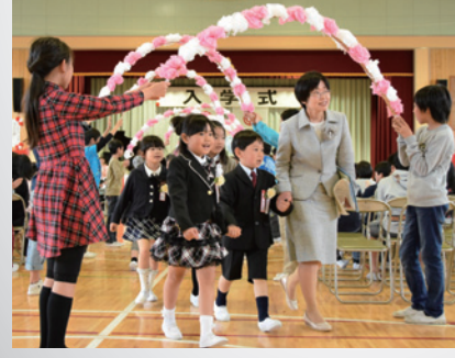
柏原小学校の入学式

柏原小学校の入学式では、新1年生が、少し緊張した面持ちで入場。上級生の歓迎のあいさつに続き、校長先生からは、『『あいさつ』、『あんぜん』、『あきらめない』、この3つの『あ』を達成すべく、この学び舎で励んでください』と、話がありました。入学式の後、目を輝かせながら仲良く手をつないで教室に向かう1年生は、今日から元気なさやまっ子に仲間入りです。