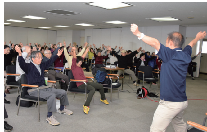
家庭でも気軽に取り組みます

簡単な設問に答えることにより、認知症になる前に低下しやすい脳機能の状態を知ることができるテストです。51名の参加者は、自分の脳の状態を確認した後、理学療養士と一緒に、認知症予防に繋がる運動を体験しました。