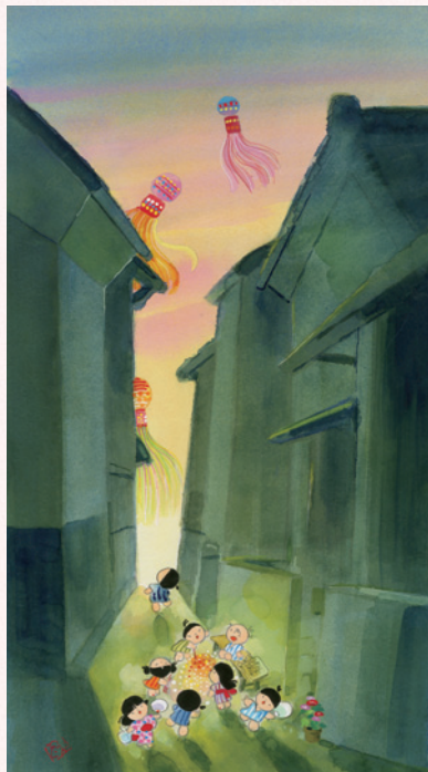
題字・童絵/池原昭治氏