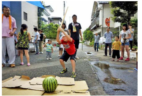
割ったスイカはみんなで分けておいしくいただきました

私たちの自治会は、狭山市の東端、川越市に程近い場所に建つマンションの住人で構成されています。約50世帯が加入し、住民相互の親睦を図る活動に力を入れています。特に「夏祭り」と年末の「餅つき」は、子どもから高齢者まで幅広い年齢の会員が一堂に会するイベントとして好評で、会員同士の顔の見える関係づくりが図られています。また、高齢者が気軽に参加できる談話の場「茶話会」も月に1回開催。参加者が、お茶を飲みながらおしゃべりを楽しみ、交流を深めています。 今後、いざというときに助け合えるコミュニティづくりを目指していきます。