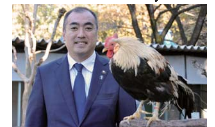
特別天然記念物の「尾長鶏」と一緒に