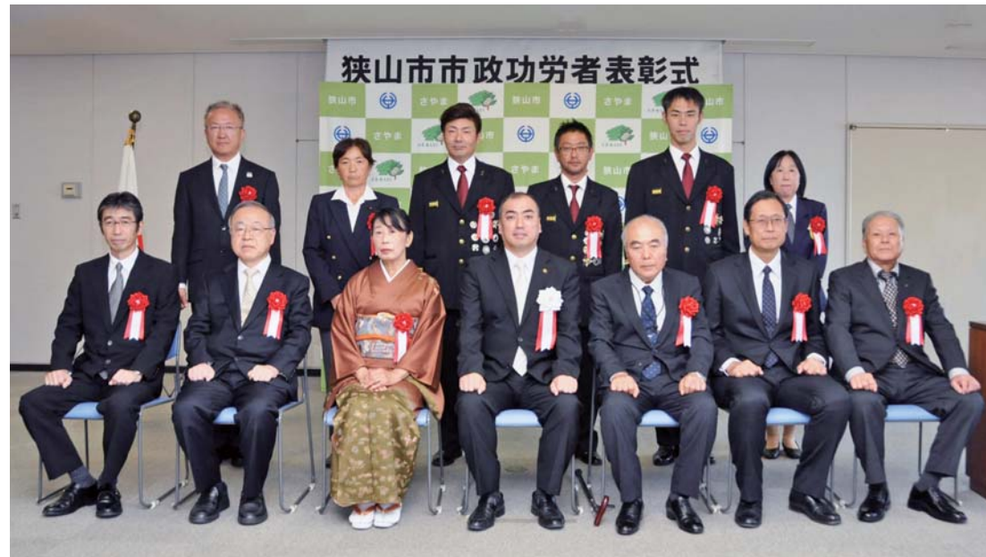
一般功労と感謝状の受賞者

バトンを渡された世代が、その時代を知恵と工夫と努力で走りぬぎ、次の世代を信じてまたバトンを渡していく。干支も申から酉へとバトンパスとなります。来年も狭山市が羽ばたけるように頑張ります。