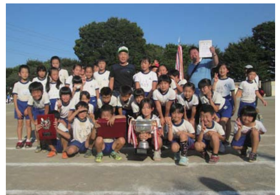
体育祭では子ども会のみんなも力を合わせて、勝利を掴みました

私たちの自治会は、柏原小学校の北側に位置し、智光山公園や畑などに囲まれた自然あふれる地域にあります。 現在211世帯が加入し、自治会活動のほか、ソフトボールや民踊などのクラブ活動も盛んで、子どもから高齢の方まで幅広い世代が交流を深めています。今年の柏原地区の体育祭では2年連続で総合優勝を果たし、地域の絆が一層深まりました。また、安全パトロール隊も結成し、地域の安全安心のために取り組んでいます。 今後も、互いの顔が見える関係を大切にしながら、共助の精神に培われた自治会を目指していきます。