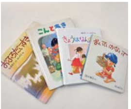
絵本の数だけ世界が広がります

今では、多く子ども達に絵本の素晴らしさを伝えたいと思い、児童館などで読み聞かせの活動をしています。読み聞かせの途中で「シーン」と静かになり、終わったときに「ハァー」というため息が聞こえてくると、子ども達が本の世界に入り込んでいたことを実感します。そんな子ども達と濃密な時間を共有できることが一番の幸せです。