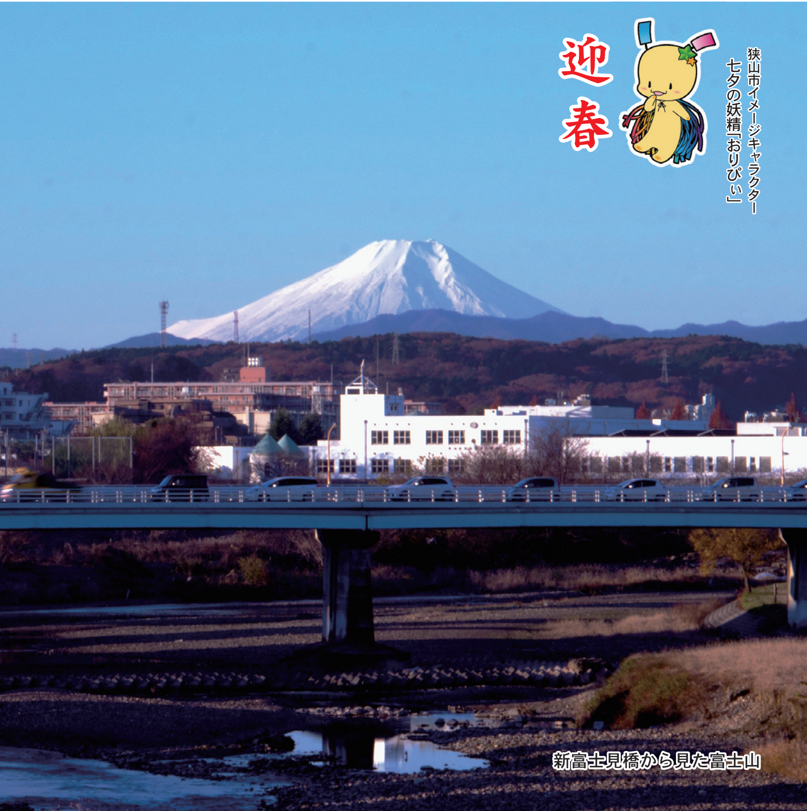
新富士見橋から見た富士山