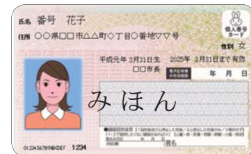
【マイナンバーカード(表)のイメージ】

※個人番号カードの交付を受けるには申請が必要です。詳しくは、下記のマイナンバーコールセンターへお問い合わせください