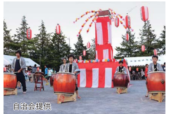
7月の納涼祭で太鼓(狭山グリーン太鼓)を演奏する子ども達

私たちの自治会は、入間川に架かる豊水橋の近くにある団地の住民で構成され、336世帯が加入しています。河川敷公園をはじめ、四季の移ろいを感じられる、自然豊かな地域環境が魅力です。会員の高齢化が進む中、「元気な笑顔」を自治会のモットーに、常日頃から役員が見守り活動をしたり、近所同士で声掛けを行ったりして、顔の見える関係づくりを進めています。また、太鼓や踊り、バンドなどや趣味を通じたサークル活動も活発で、会場の集会所は、いつも活気にあふれています。 これからも、狭山市全体に元気を発信できる自治会を目指して活動していきます。