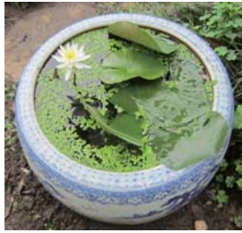
火鉢を見ては、子どもの頃に思いを馳せます

今では、生活の中で使うことも無く、庭先から我が家を見守っています。家族との思い出が詰まったこの火鉢。これからも家族の歴史を刻んでいきます。