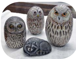
石なのに温もりが感じられそうな出来栄です

素材の石は、夫が釣りに出掛けた折りに拾ってきたもので、アクリル絵の具を使って丹念に描かれています。仕上げに、目に特別な液体をのせることで、動物は生き生きとした表情になっていきます。そして不思議なことに石の冷たさは消え、例えば、ネコの背中を撫でみると快い気分になるのです。