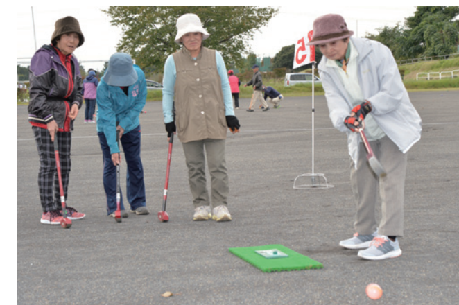
集中してボールの行方を見守ります

ゲートボール、グラウンドゴルフ、パターゴルフ、ペタンの4つの種目を同時に開催する大会に、370人以上の元気なシニアが参加しました。会話を楽しみながらスポーツに親しみ、「健康づくり」「体力づくり」「仲間づくり」の輪が広がりました。