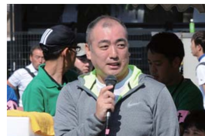
地区体育祭でエールを送りました

少子化に伴い、やむなく統廃合した学校ではありますが、視点と使い方を変えれば「宝」へと変わります。狭山市は素晴らしいまちです。まだまだ眠っている「宝」があちこちにあるはず。ぜひ一緒に「宝」を見つけていきましょう。