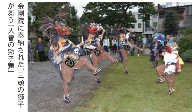
金剛院に奉納された、三頭の獅子舞(入曽の獅子舞)

市内各地の神社や寺院で、五穀豊穡を願う大祭が執り行われました。金剛院と入間野神社では、笛や太鼓、ささらの音が響く中、「入曽の獅子舞」(県指定無形民俗文化財)が奉納されました。また、笹井白鬚神社では、仰向けに寝た演者が両脚を立て、足の甲に面をつけ、お囃子に合わせて踊る「笹井豊年足踊り」(市指定無形文化財)が奉納され、そのユーモラスな踊りが見物に訪れた人たちを魅了していました。