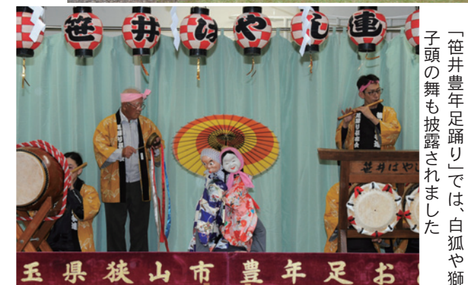
「笹井豊年足踊り」では、白狐や獅子頭の舞も披露されました