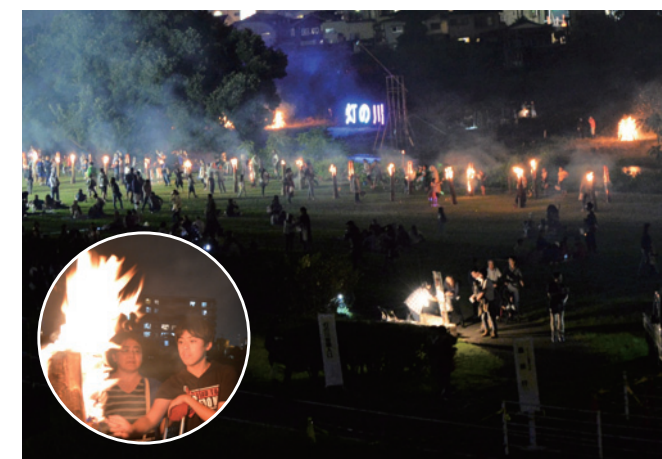
「森のろうそく」と「大篝火」の競演は最大の見せ場です

川に親しみ、源流域の森に想いを馳せてもらおうと、10年前に始まった市民手作りの祭典。間伐材を使った「森のろうそく」に魅了された20,000人を超える来場者は、グルメを堪能したり、和太鼓やバンドの演奏などを楽しんだり、秋の夕べを過ごしました。