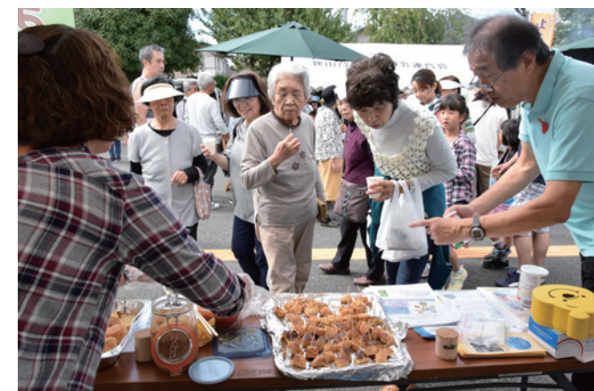
郷土料理などのほか災害用非常食をアレンジした試食コーナーも

全国から多くの方が移り住んだ狭山台地区の特色を生かし、地域の住民がそれぞれ生まれ育ったふるさとの郷土料理や狭山の食材を使った創作料理を披露する食のお祭り。1,000人を超える来場者は、手作り料理に舌鼓を打ちながら、食欲の秋を満喫しました。