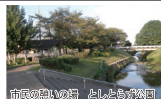
市民の憩いの場 としとらず公園

「不老川」は、その昔、雨が少ない冬に川が干上がり、年を越さないことから「年不取川」と呼ばれています。また、地元には「節分の晩に、川にかかる橋の下で一夜を明かすと、齢をとらない」という伝説も残っています。