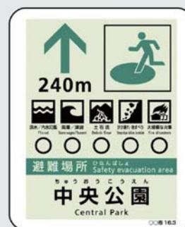
誘導標識のイメージ 問合せ 危機管理課へ内線3695

この誘導標識では、避難場所などが、どのような災害に対応できるかを分かりやすく図や記号で表現しています。