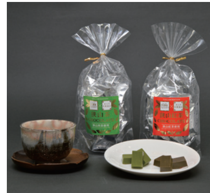
ほどよい甘さがお茶に合います