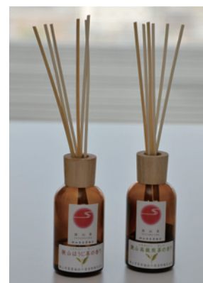
優しい香りに心が癒やされます

八十八夜の5月2日から、市役所や市民交流センター、地区センターなどに設置し、狭山茶の香りで皆さんをお迎えしています。