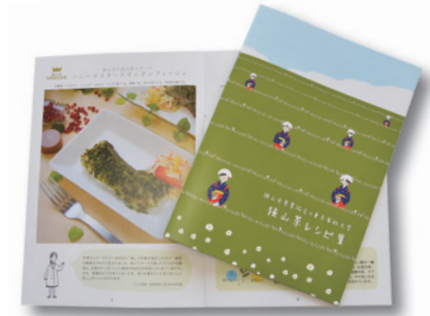
レシピ集には、コンテストで入賞したメニューのほか、お茶の淹れ方や茶がらの利用などのコラムも掲載されています

学生たちは、狭山茶の歴史や特長を学び、実際に茶摘みも体験しながらレシピを考案。応募のあった44のメニューの中から、「狭山茶スープの熱杏仁豆腐や「ハニーマスタードオニオンフィッシュ」など6つのメニューが入賞し、「狭山茶レシピ集」として発行しました。冊子は、市内の茶園でご覧いただけます。