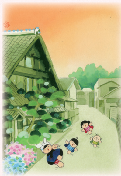
題字・童絵・文／池原昭治氏

水富の根岸を南北に通る道は、日光協往還と呼ばれ、日光東照宮の火の番をする「八王子千人同心」が八王子と日光を往復した街道でした。明光寺参道入口前あたりが、昔日の面影を今に残す風景です。