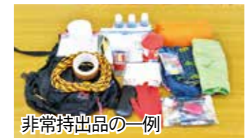
非常持出品の一例

出品を準備しておきましょう。また、被災後に、自宅などで生活する場合もあります。電気や水道などが止まったとしても自力で生活できるように、マ