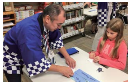
ワージントン市の小学生と折り紙で交流しました

米国に学ぶ点は多々ありましたが、それと同時にこの差を埋め、より豊かでよい社会を築いていかなくては、という前向きなエネルギーが沸いてきました。狭山市からのお土産の抹茶「明松」や折り紙などは「ワオ!」と大好評でした。日本文化はやっぱり素晴らしい!