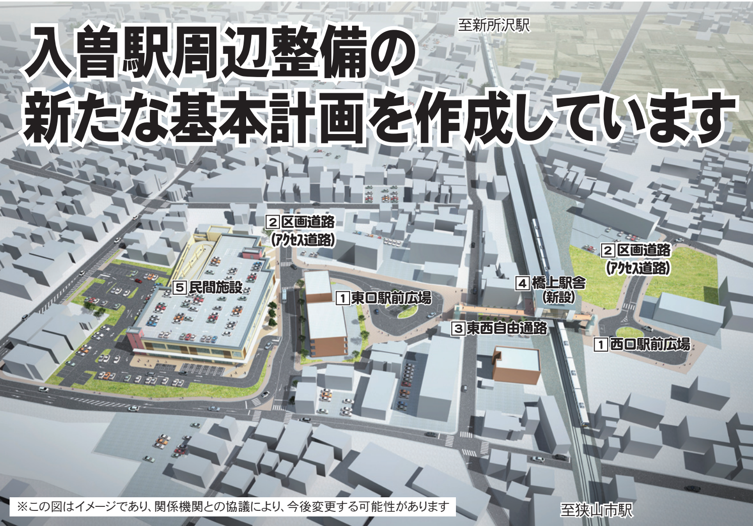
※この図はイメージであり、関係機関との協議により、今後変更する可能性があります

市では、長年の懸案である入曽駅周辺地区の整備について、交通対策などの課題を解決するとともに、市南部の地域拠点とするため、入間小学校跡地などを活用した新たな基本計画を作成しています。 今月は、この計画の概要とパブリックコメントの実施についてお知らせします。