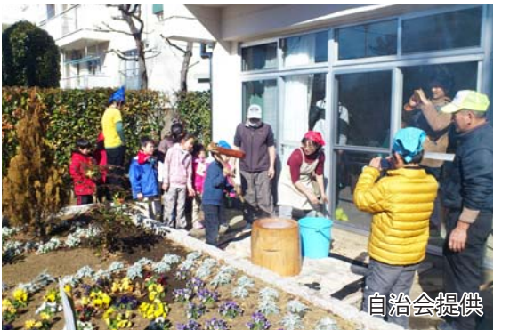
子ども達もたくさん参加して餅つきを体験。会員以外の方へは安価で販売しています。

私たちの自治会は、狭山台団地の約半数となる1千60世帯が加入しています。近年、核家族や一人暮らしの高齢者が多く、近隣との関係も希薄になりやすいことから、コミュニティづくりの重点を置いた活動に取り組んでいます。中でも、誰もが気軽に集え、昼食会やカラオケなどを楽しめるカフェを2か所、お茶だけの無料サロンを1か所開設し、住民同士の親睦を深める場となっています。また、毎年1月には、餅つき大会も行い、つきたてのお餅がお目当ての、多くの親子連れで賑わいます。これからも住民同士の親睦を深め、顔が見える関係づくりに取り組んでいきます。