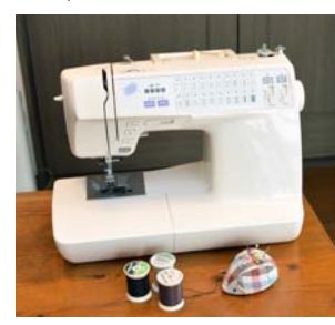
毎日のように使う、大切なパートナーです

これまで、子どもの成長に合わせて、娘たちのお揃いの洋服や幼稚園の小物入れなど、このミシンでたくさん作りました。その洋服などを、娘たちが喜んで着てくれているのを見ると嬉しくなり、次は何を作ろうかと考えるのも楽しみの一つです。家族を笑顔にしてくれる大切なミシン。母に感謝し、これからも家族の絆を紡いでいきたいと思います。