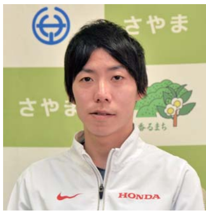
マラソン日本記録保持者 Honda 陸上競技部 設楽悠太さん(狭山市在住)

本田技研工業(株)に入社した設楽さんは、目標だった兄より先に世界への切符を手に入れることになりました。2015年の世界陸上と翌年のリオ五