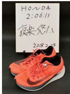
日本記録更新の色紙と練習で履いていたシューズ

輪で1万メートルの日本代表に選出されたのです。レースで結果は残せませんでしたが、世界のスピードとの差を痛感したこのときの経験が、自らのスタイルである「攻めの走り」につながっている」と語ります。そして昨年の東京マラソンでフルマラソンに初めて挑戦し、1年後の今年、日本新記録で日本中を沸かせてくれました。「メンタルが強くなった」と、その要因を語る設楽さん。きっかけは、昨年9月のモハメド・ファラー選手(英国・ロンドン五輪とリオ五輪のゴールドメダリスト)との対談だったそうです。ファラー選手「自分を信じる。負け