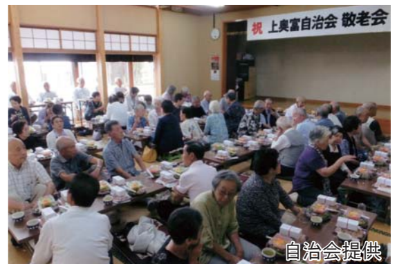
昨年も「自治会敬老会」では、和気あいあいと、笑いつつまれた楽しいひと時を過ごしました

上奥富には、「東部」「中部」「西部」の3自治会があり、多くの事業を合同で行っています。豊かな地域で、商業施設も近くにあることから、転入者も多く住んでいます。こうした中で、地域の伝統行事である「梅宮神社の甘酒祭り」(県指定無形民俗文化財)や夏祭り、敬老会、体育祭などをとおして各自治会との交流を深め、地域の絆を強めています。また、西部自治会を中心に、地域住民の憩いの場でもある入間川の河川敷清掃を毎月行い、参加した子どもたちが、自然環境の大切さを学んでいます。 これからも人と人とのつながり、「輪」と「和」を大切に地域を目指していきます。