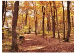
美しい狭山の雑木林をこれからも守り続けます このコーナーは市民の皆さんを取材して作成しています

狭山の雑木林の新緑の多様さと、色彩の豊かさは、常緑樹の多い和歌山育ちの私の心に強く響き、印象に残りました。