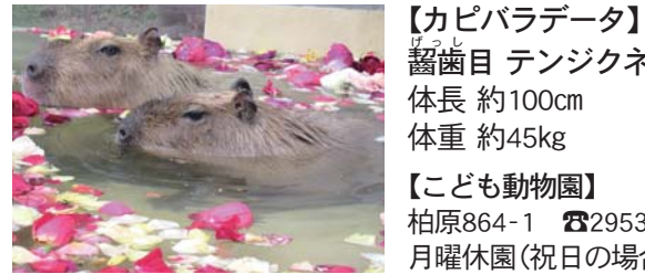
【カピバラデータ】 齧歯目 テンジクネズミ科 体長 約100cm 体重 約45kg

カピバラはネズミの仲間、その中には体長が世界最大です。南米の川や湖に20頭ほどの群れで生息しています。四肢の指の間にある水かきを使い、上手に泳ぐことができます。性格は非常に穏やかで、人によく近づきます。当園では、メゴ(オス・9歳)とユメ(メス・4歳の2頭を飼育しています。3月31日(日)までの土・日曜日、祝日と平日の偶数日には、カピバラ温泉を開催。寒さに弱いカピバラがゆつたりと温泉に入るようすを観察してみてください。