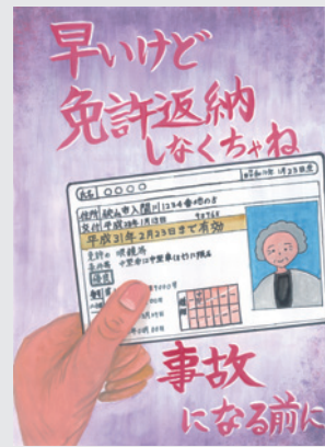
【ポスターの部】 おつしまみお 松島美桜さん (新狭山小6年生)

生 定員20名 費用3千500円 申込み 2月19日(火)から同館へ ◆スポーツ教室 親子体操/日時 2月22日、3月1・8・15日(金)、11時～12時 対象 2～4歳児と保護者 定員 各日25組 キッズ体操/日時 3月11日(月)、15時15分～16時15分 対象 4～6歳児(保護者同伴) 定員 15名 共通事項/費用 一回500円