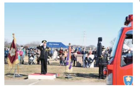
消防団員たちの活動に気持ちも引き締まります

私たちは多くの社会課題と直面しています。その課題を解決しようというとき、より多くの共感と力を集め、共に歩むことの大切さを改めて学ぶことができました。子ども達の明るい未来を、一緒に守っていきましょう。