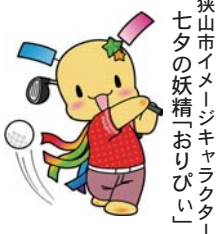
狭山市イメージキャラクター「七太の妖精おらびこ」

リオデジャネイロ2016大会で112年ぶりに復活したゴルフ競技が、東京2020大会では川越市・狭山市・日高市に所在する霞ヶ関カンツリー倶楽部で行われます。男子、女子それぞれ60名の選手が4日間で4ラウンド、72ホールをプレーし、合計の打数が一番少ない選手が金メダルを獲得します。 競技日程男子…2020年7月30日(木)〜8月2日(日) 女子…2020年8月5日(水)〜8日(土)