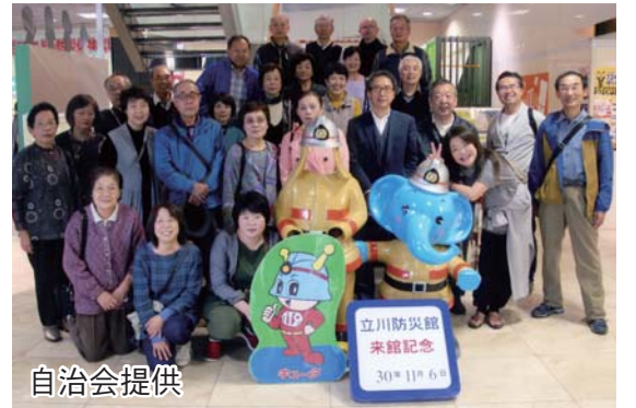
研究会では、AEDと消火器の操作訓練を体験。東京消防庁のOBが案内してくれました

私たちの自治会は、入曽駅の東側に位置し、区内には入曽公民館や、入曽駅周辺整備が予定されている入曽小学校跡地があります。近年、宅地の開発が進み、子どもの数も増えたため、自治会主催の小さなお祭り(餅つき・昔遊び)などをとおして、会員の親睦を深めています。また、リサイクルセンターなど生活に関連した施設の見学や、救命講習などを行う研修会は、10年以上続いており、こうした日常では体験できない活動を行うことで、会員の知識を深めています。これからも会員相互に助け合い、住みよい地域をつくっていききたいと思えます。