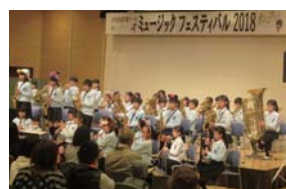
市内で活動している音楽やダンスサークルなどの発表会です。

さやま生涯学習サークルミュージック&ダンスフェスティバル2019 市内で活動している音楽やダンスサークルなどの発表会です。 日時3月23日(土)、10時〜16時20分 場所市民交流センター 問合せ社会教育課内線5673 生涯学習情報コーナー ☎2937・3621