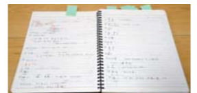
努力の結晶ともいえるこのノートを見ると、頑張れます

私の宝物は、留学当初に日本語の勉強していた頃の「ノート」です。 私が日本語に興味を持ったのは、高校2年のときに出合った「ひらがな」がきっかけでした。韓国語にはない曲線美と、「はらい」や「はね」の美しさに、とりこになりました。元々は違う学問に興味がありましたが、それからは日本語の勉強に没頭しました。 そして、念願が叶って日本に留学したのは26歳の時です。日本語の勉強で一番苦労したのは「濁音」でした。韓国語は一定のルールに従って濁音が付きますが、日本語は「サル」と「ザル」のように、濁音の有無で全く違う意味の言葉になってしまいます。また、擬態語や擬音語などは絵を描いて覚えるようにしました。