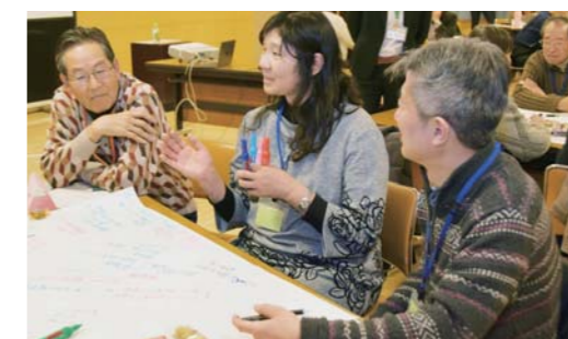
▲地域の課題を本音で対話