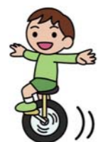
小学生(初心者) 対象①

11時30分 対象1歳6か月～2歳児と保護者 定員8組 申込み3月19日(火)から同館へ ◆小さなアルバム作り 日時4月12日(金)、10時30分～11時 対象2～3歳児と保護者 定員10組 申込み4月2日(火)から同館へ ◆31年度のクラブ員を募集 ゆうゆうクラブ員 / 日程4月～32年2月の土曜日(全12回) 内容工作、遠足など 対象小学生 定員20名 ※活動内容により実費が必要 申込み4月7日(日)に同館(当日説明会あり。保護者同伴で印鑑を持参)へ 一輪車クラブ員 / 日程5月～32年3月の土曜日(全11回) 対象①小学生(初心者) ②小学生(空中乗りやアイドリングができる方) 定員各回15名 申込み4月14日(日)に同館(当日説明会あり。保護者同伴で印鑑を持参)へ 手芸クラブ員 / 日程5月～12月(全7回) 対象小学4～6年生 定員4名 ※活動内容により実費が必要 申込み4月14日(日)に同館(当日説明会あり。保護者同伴で印鑑を持参)へ