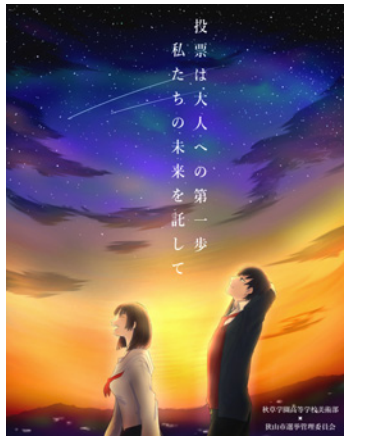
選挙啓発イラスト デザイン：秋草学園高等学校