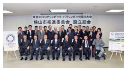
東京2020オリンピック・パラリンピック競技大会狭山市推進委員会を設立。オール狭山でオリンピックを盛り上げていきます

人生100年時代を迎えた今、多くの皆さんが長く住むまちだからこそ、一人ひとりにとって狭山市が「いいまち」であって欲しい。そんなことを考える今日この頃です。