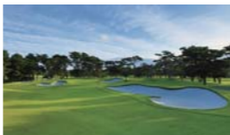
東2番ホール

2020年オリンピックでゴルフ競技の会場となる霞ヶ関カンツリー倶楽部は、1957年に、国内で開催した初のゴルフ国際大会「カナダカップ第5回大会」の会場となったほか、国内屈指の大会である日本オープンゴルフ選手権など、数々の大会が開催されています。また、2017年にはドナルド・トランプアメリカ合衆国大統領が訪日した際に、安倍晋三内閣総理大臣とゴルフを楽しむ舞台となりました。