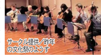
昨年の文化祭のようす

23年前の体験講座をきっかけに結成した私たちの会は、金曜日の夜に富士見公民館で活動しています。 何度か会員の入れ替えがあり、現在も会員の多くは初心者です。練習は基本を大切にしつつ、各自が自由に好きな曲を選べるため、楽しく学ぶことができます。また、独奏だけではなく、重奏や合奏にも力を入れていて、結成当初に先生が作曲した、会のテーマ曲「君が住む街」は今でもレパートリーの中心となり、公民館の文化祭で披露しています。