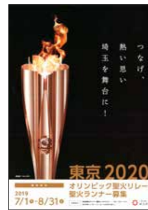
※オリンピック聖火リレー聖火ランナー募集パンフレット(埼玉県)