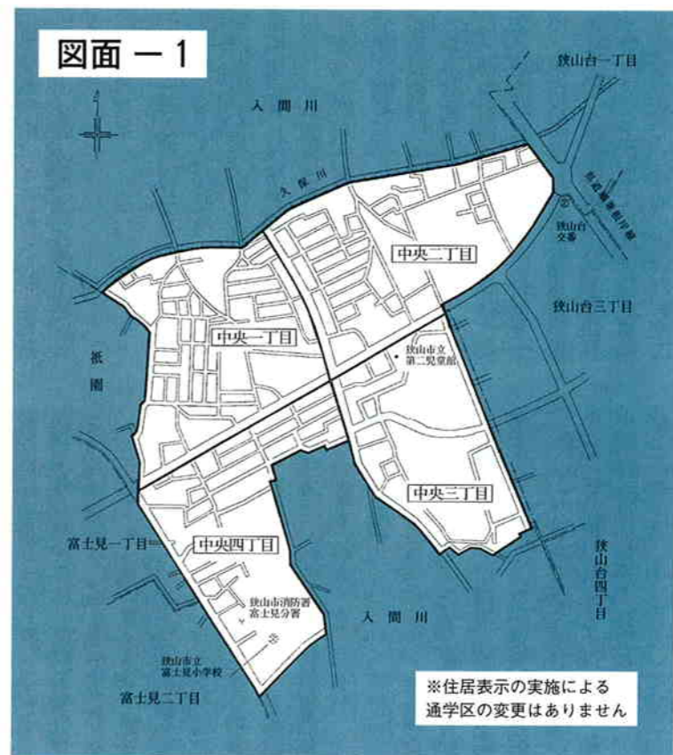
※住居表示の実施による通学区の変更はありません

今までは「住所・不動産・戸籍」の表示に、土地の番号である地番が使用されてきましたが、住居表示の実施後は右上の例のように使い分けることになります。 なお、「戸籍」については転籍の届け出により街区符号による表示も可能となります。