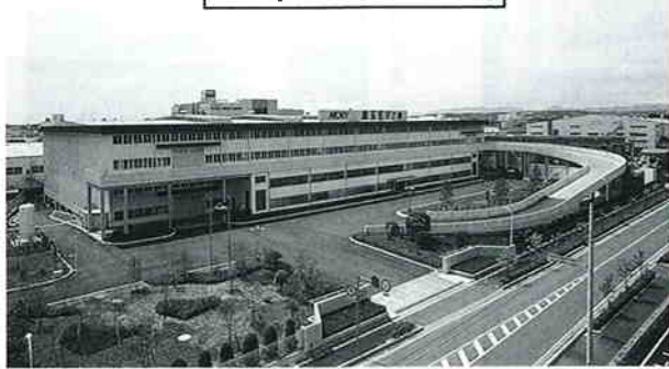
関東モリ工業株式会社 上広瀬5911-8 ☎5413011