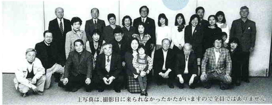
上写真は、撮影日に来られなかったかたがいますので全員ではありません

狭山市の市政モニター制度は、市民とともに歩む市政を基本として建設的な市民皆さんの声を広く市政に反映させる目的で設置されたものです。毎年4月から翌年の3月までを任期とし、30名の皆さんにご協力をいただいています。具体的には、年に4回のモニター会議のほかに、3つの班に分かれてグループ会議などを行います。7年度の研究テーマはそれぞれ次のとおりで、1年間の取り組みに対する大変貴重な報告書を提出していただきました。報告書は今後の市政運営の参考として活用させていただきます。一年間お疲れ様でした。