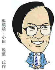
狭山市長 町田潤一

A 平成8年度も、平成6・7年度に引き続き特別減税が実施されます。平成8年度は、平成7年度と同様に所得割額の15%相当額で最高2万円を限度として、所得割額から差し引かれます。特別徴収で住民税が給与天引きになっている場合は、7月分が天引きされず7月分から11回で給与天引きされます。また、普通徴収で個人で納める場合は第1期分から特別減税分が差し引かれています。 問い合わせ市民税課へ内線114